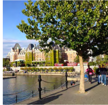
Der Hafen von Victoria mit dem Fairmont Empress Hotel