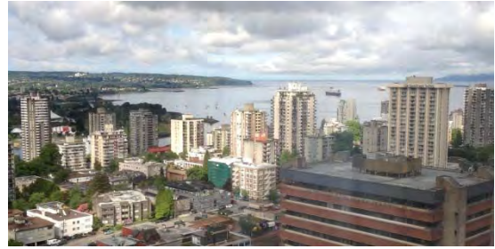
Blick über Vancouver

British Columbia, set between the Rocky Mountains and the Pacific Ocean, has every type of geography: beaches, lakes, mountains and forests. Vancouver, its largest city, is vibrant and multi-cultural. From Vancouver, you can take a seaplane to BC's capital, Victoria, landing in the harbour in front of the impressive Fairmount Empress Hotel. In BC you can ski, snowboard, row, play golf, go camping, go whale-watching, mountain bike, eat fabulous seafood and shop. Just not all on the same day!